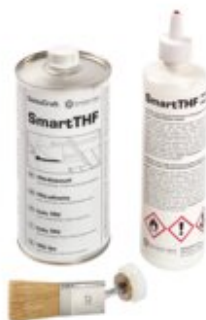
WELD, Flasche + Pinsel