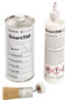
WELD, Flasche + Pinsel